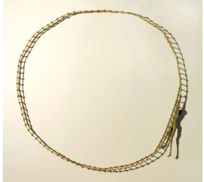
Heroes, 2006 corda e acciaio cm 20 x 160 x 160