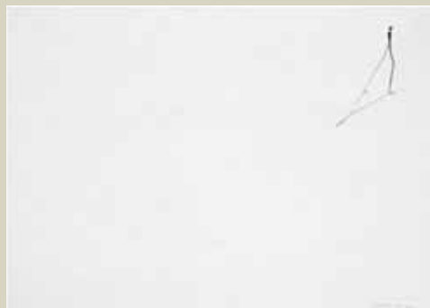
Hombre, 2004 tecnica mista su carta cm 29,7 x 21