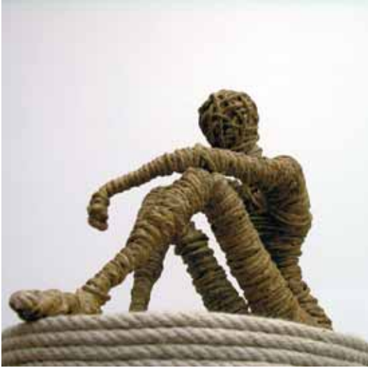
Heroes, 2007 corda annodata e acciaio cm 45 x 225 x 45