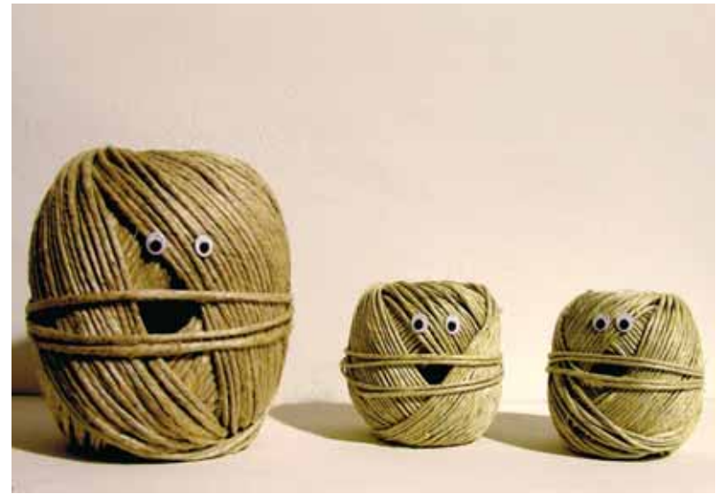
Gomitolini, 2006 PVC su corda e acrilico su legno edizione, misure variabili