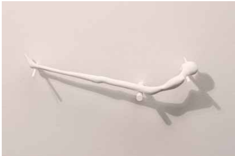
Equilibrio, 2004 acrilico su resina e Plexiglas, 6 + 1 cm 30 x 8 x 8