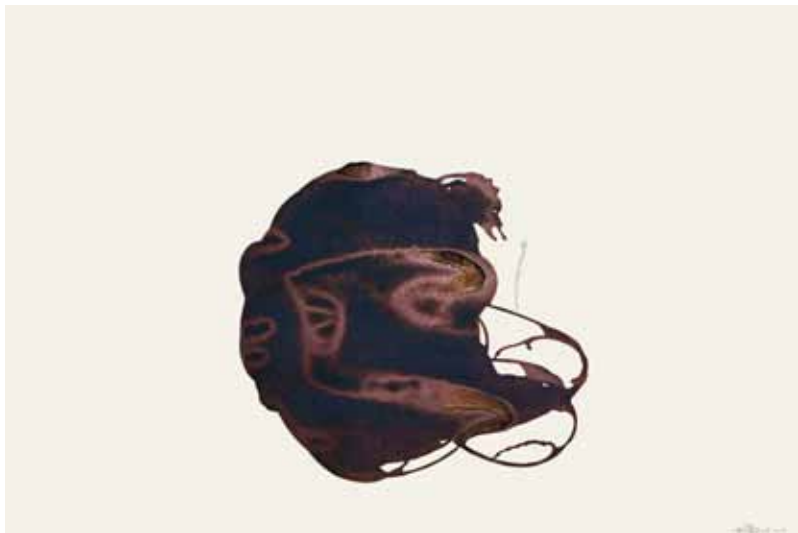
Senza titolo, 2003 tecnica mista su carta cm 70 x 100