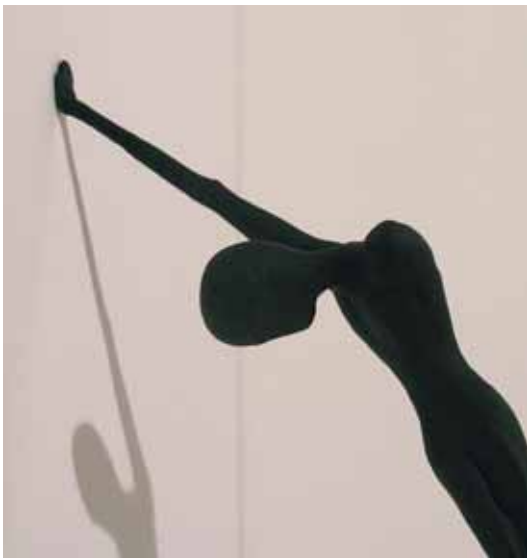
Heroes, 2007 bronzo patinato 6+1 cm 10 x 50 x 32