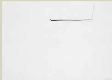
Hombre, 2004 tecnica mista su carta cm 29,7 x 21